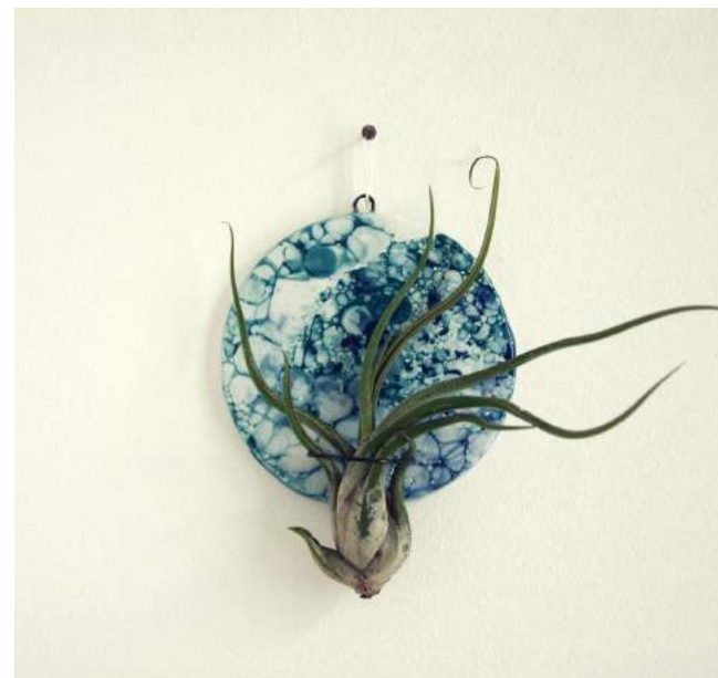
TILLANDSIA CAPUT MEDUSAE